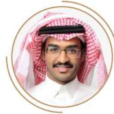
فواز يحيى حسين حل