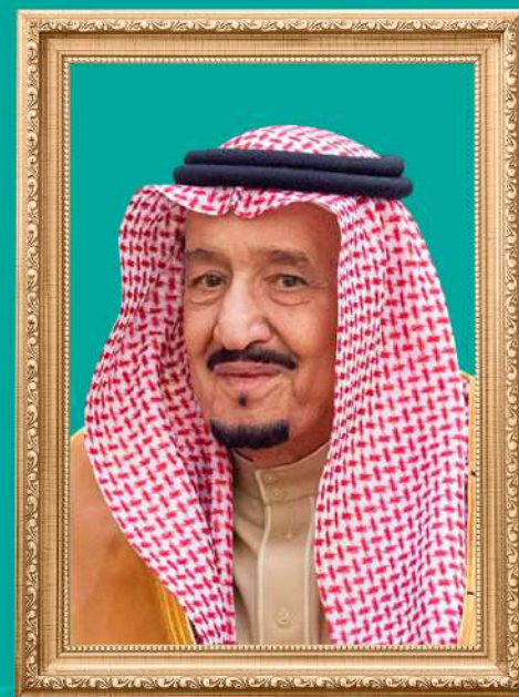
خادم الحرمين الشريفين الملك فهد بن عبدالعزيز آل سعود ملك المملكة العربية السعودية