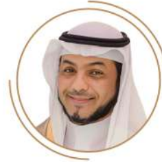
د.راشد علي حسن حل