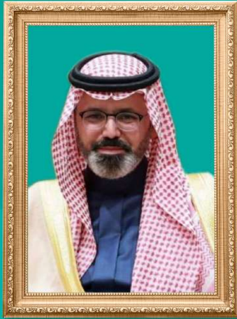
نائب أمير منطقة جازان

الأمير ناصر بن محمد بن عبد الله بن جلوي السعدي