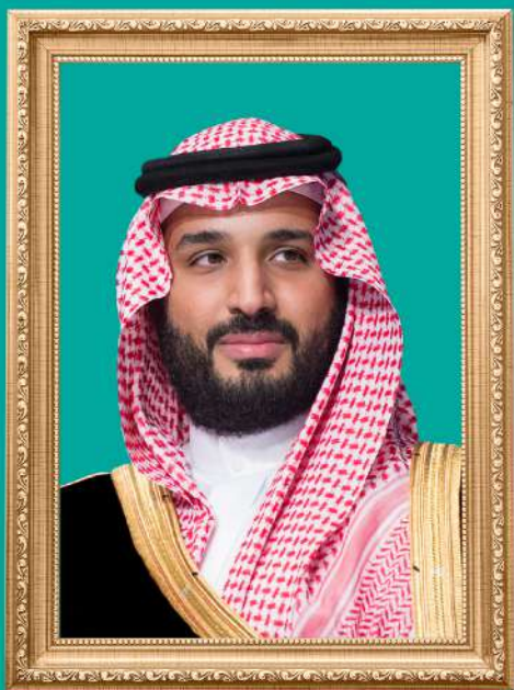
صاحب السمو الملكي الأمير محمد بن سلمان بن عبدالعزيز آل سعود ولي العهد رئيس مجلس الوزراء