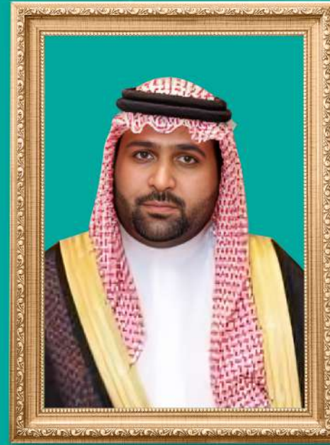
أمير منطقة جازان

الأمير ناصر بن محمد بن عبد الله بن جلوي السعدي