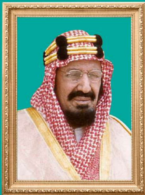
مؤسس المملكة العربية السعودية الملك عبدالعزيز آل سعود